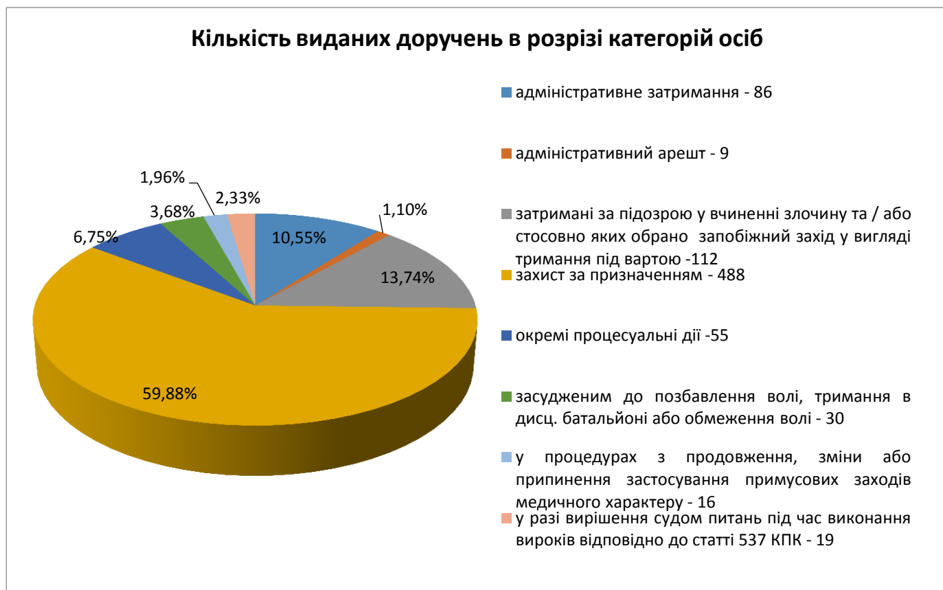
Таблиця 1. Інформація щодо кількості виданих доручень адвокатам для надання БВПД в розрізі категорій осіб